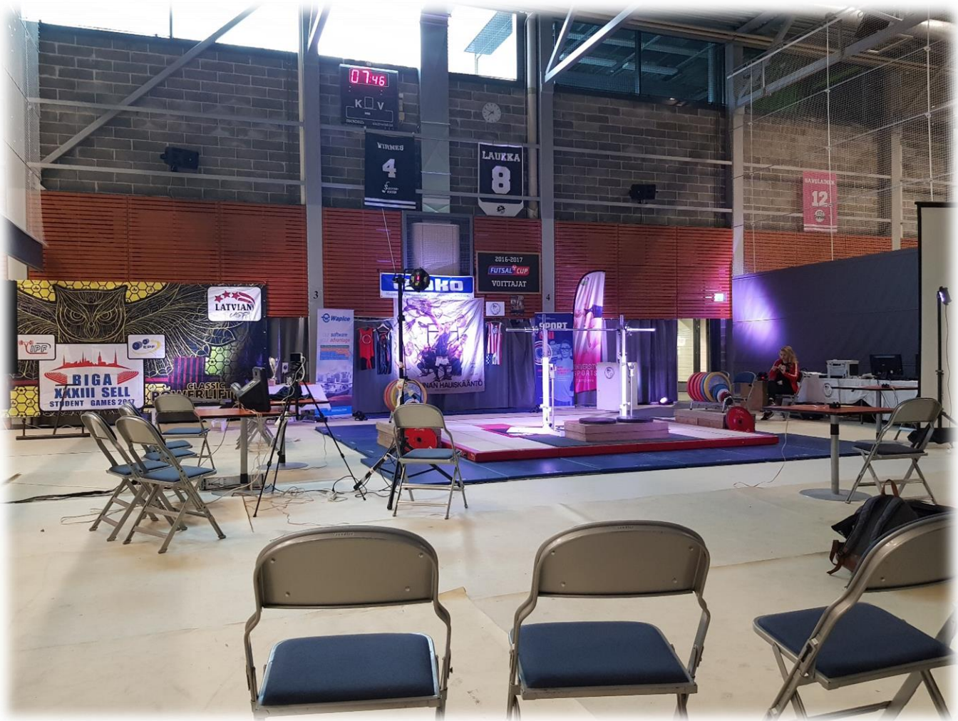
Kilpailupaikkana toimi tänäkin vuonna Tampereen yliopiston Tamppi Arena

OSMien voimanostossa kilpailu käydään pistekisana, jolloin sijoitukset ratkeavat IPF-pisteiden mukaan (painonnostossa kisataan vastaavasti Sinclair-pisteissä ja Supertotaliin osallistuvien pisteet molemmissa lajeissa lasketaan yhteen). Kisat on jaettu vielä toisen asteen (ammattikoulut ja lukiot) sekä korkea-asteen (ammattikorkeakoulut ja yliopistot) kesken siten, että toisen asteen opiskelijat kisaavat toisiaan vastaan ja korkea-asteen opiskelijat keskenään. Kaikki opiskelijat edustavat myös oppilaitostaan, jolloin kaikki osallistuvat oppilaitosten väliseen joukkuekilpailuun, jossa ratkaistaan kiertopalkinto Voimanpesän kohtalo. Vuonna 2019 painonnosto kisattiin lauantaina ja voimanoston vuoro oli sunnuntaina 14.4. Rentosarjalaiset kilpailivat aamupäivällä ja kilpasarjalaiset päästettiin irti iltpäivällä. Seuraavassa lyhyt raportti kilpasarjan osalta.