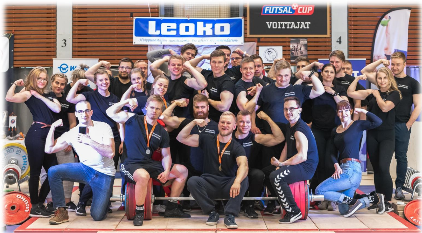
Herwannan Hauiskääntöön jäsenistöä 14.4.2019

Herwannan Hauiskääntö (IF Sibbo Vargarna)